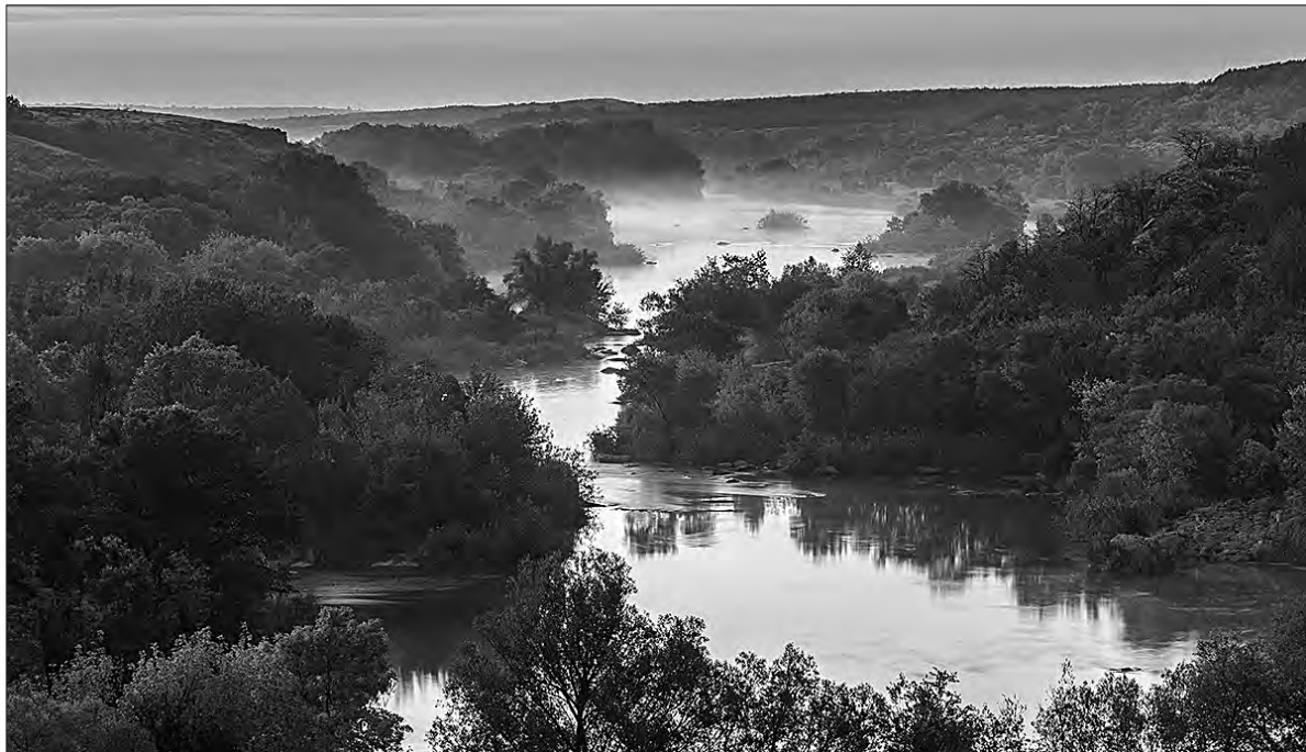
Мальовничі ландшафти «Гранітно-степового Побужжя».

На жаль, Бузький Гард, на території якого був розташований центр паланки Війська За-