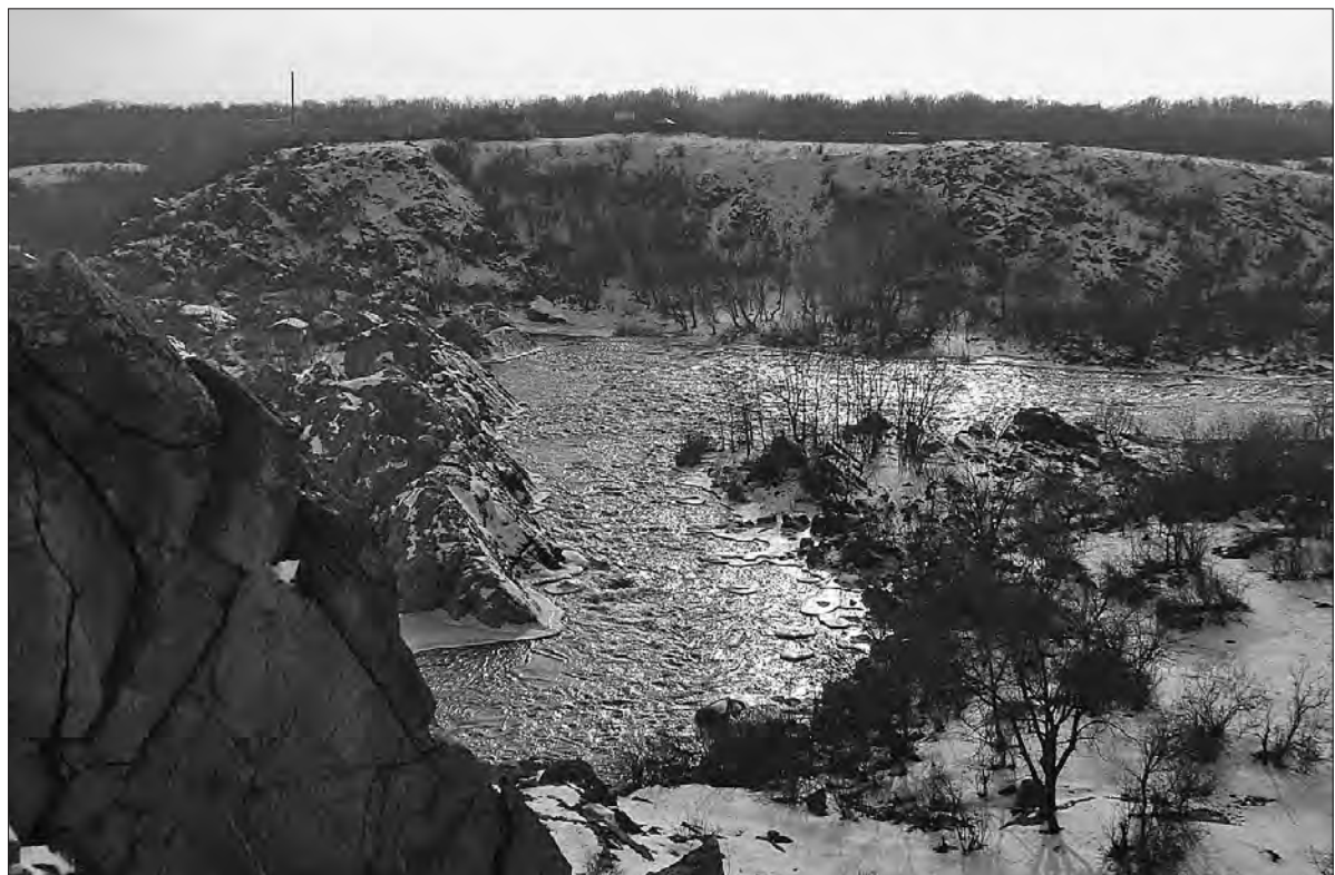
Серед рівнинного степу раптом виникають скелі.

Тваринний світ надзвичайно багатий та різноманітний. Тут