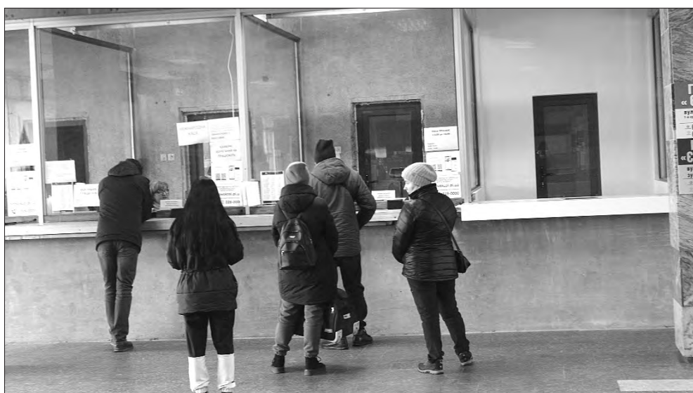
Навіть у п'ятницю охочих придбати квитки в касах полтавського автовокзалу небагато.

Такі закиди протестувальниці заступник голови облдержадміністрації списав на емоції конкурентки, котра, мовляв, сама далеко не завжди та не в усьому дотримується правил пере-