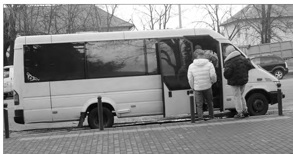
На зупинці поблизу полтавського «Макдональдсу» (напрямок руху — в бік Харкова) перевізники-нелегали нерідко набирають повні маршрутки пасажирів.