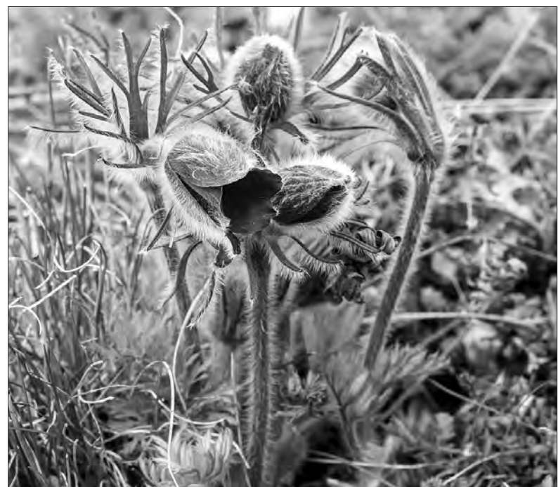
Навесні на схилах парку розквітає сон лучний.